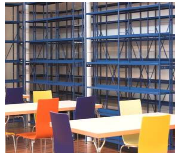
BIBLIOTECA MUNICIPALE DI RONCADE

Via Dall'Acqua, 25 31056 Roncade (TV) Tel. 0422 840593 Fax 0422 846224 e-mail: biblioteca@comune.roncade.tv.it http://www.bibliotecaroncade.it